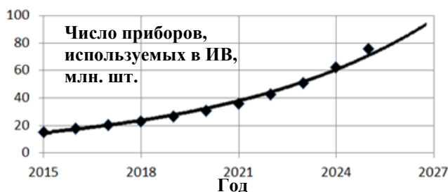
Рис. 1. Тенденция потребления устройств интернета вещей

Анализ развития рынка интернета вещей (ИВ) показывает его дальнейший экспоненциальный рост [1] (рис. 1).